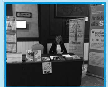
ปีโอไอภาคที่ 1 (เชียงใหม่) ออกบูธนิทรรศการคลินิกนักลงทุน ในงานประชุมสภาอุตสาหกรรม ภาคเหนือ ณ โรงแรมคุ้มคำ จ.เชียงใหม่ ในวันที่ 19 มิถุนายน 2559