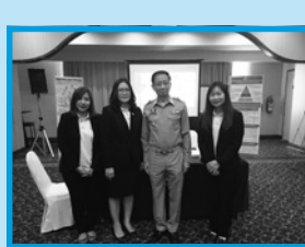
ปีโอไอภาคที่ 1 เชียงใหม่ ร่วม ออกบูธคลินิกนักลงทุนในงานประชุม ชี้ช่องทาง SMEs ไทย ด้วยมาตรการ สนับสนุนจาก IP ณ โรงแรมเซ็นทารา ดวงตะวัน ในวันที่ 16 พฤษภาคม 2559