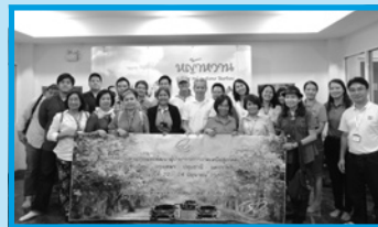
ปีโอไอภาคที่ 1 (เชียงใหม่) นำคณะผู้ประกอบการภาคเหนือ ตอนบนเยี่ยมชมกิจการที่ได้รับการส่งเสริมการลงทุนในภาคตะวันออก เชียงเหนือ ในวันที่ 22 - 24 มิถุนายน 2559