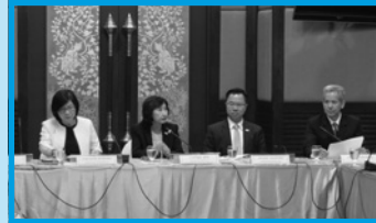
ปีโอไอภาคที่ 1 เชียงใหม่ จัดสัมมนาผู้บริหารปีโอไอ พบ นักลงทุนในภาคเหนือ ณ โรงแรม ดิเอ็มเพรส เชียงใหม่ ในวันที่ 4 เมษายน 2559