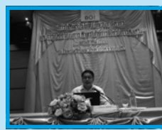
ปีโอไอภาคที่ 1 พิษณุโลก จัดสัมมนา “การใช้สิทธิประโยชน์ยกเว้น ภาษีอากรและการเปิดดำเนินการสำหรับกิจการที่ได้รับการส่งเสริม” ณ โรงแรมเรอเนอแพ รอยัล ปาร์ค ในวันที่ 25 พฤษภาคม 2559