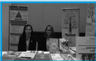
ปีโอไอภาคที่ 1 เชียงใหม่ ออกบูธ คลินิกนักลงทุน ในงาน Thailand Tech Show 2016 ณ โรงแรม เชียงใหม่ แกรนด์วิว ในวันที่ 26 เมษายน 2559