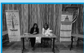
ปีโอไอภาคที่ 1 (เชียงใหม่) ร่วมออกบูธคลินิกนักลงทุน ในงาน ประชุมใหญ่สมพันธ์ท่องเที่ยว ณ ศูนย์ประชุมและแสดงสินค้านานาชาติ ในวันที่ 29 พฤษภาคม 2559